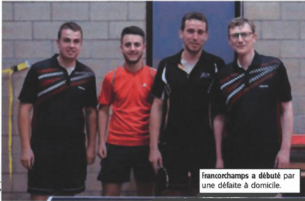
Francorchamps a débuté par une défaite à domicile.